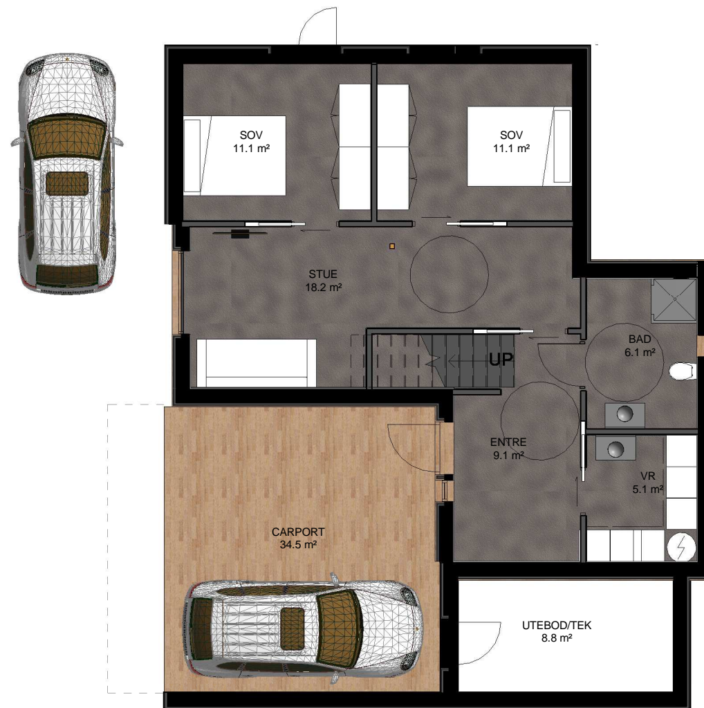
BRA 1.ETG 67.3M2